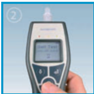
Encender el equipo y esperar unos segundos hasta la señal de "LISTO"