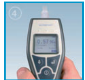
Visualizar el resultado en el display