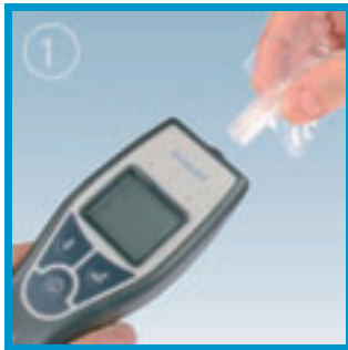
Colocar una boquilla descartable

Para cualquier situación que requiera test de alcoholemia.